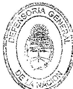
JULIAN HORACIO LANGEVIN DEFENSOR GENERAL ADJUNTO DE LA NACIÓN